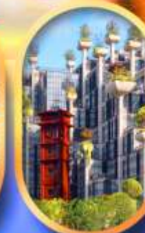
อาคาร 1,000 คับไม้