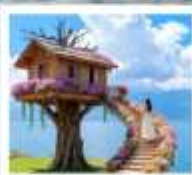
หมู่บ้านหวนนีย์

เมืองโบราณด้าหลี่ / นั่งเรือสู่เกาะเสี้ยวฉู / ซานโตรินี่ (รวมรถแท็กซี่) / ถนนชางเอ้อด้าต้า / กุซ่าววันเซียงซาน / ท่าอากาศยานหล่งกั้น โถ่ง $ ทะเลสาบเอ้อไห้ / หมู่บ้านโบราณลี่โจว / หมู่บ้านหวนนีย์ / สวนดอกไม้ตามฤดูกาล