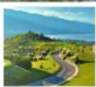
กุซ่าววันเซียงซาน