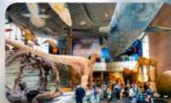
พิพิธภัณฑ์เซี่ยงไฮ้