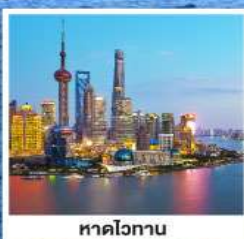
หาดไวทาน