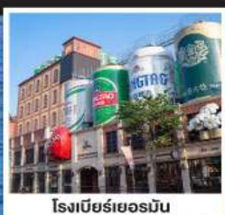
โรงแรมซือจิน