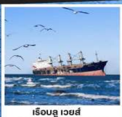
เรือลู่เว่ยซี