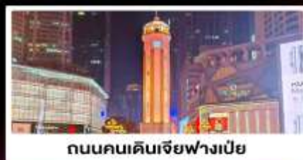
ถนนคนเดินเจียฟางเป็ย