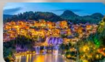
เมืองโบราณฟุทงเจิ้น