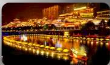
เมืองโบราณเซียนเอน