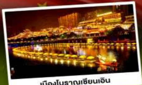
เมืองโบราณเวียงเ็น