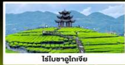
ไร่ชาอู๋โตเจีย