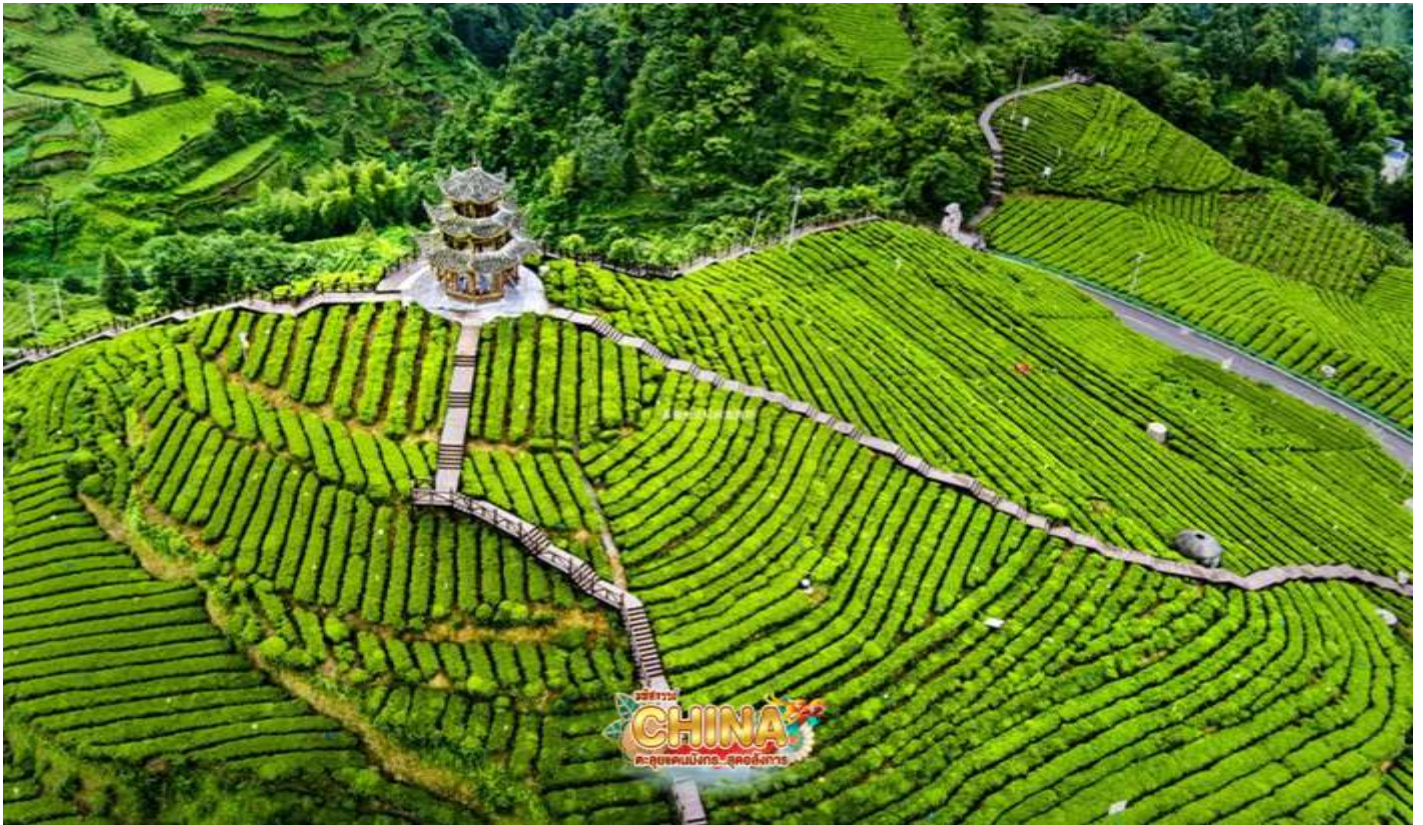
(หมายเหตุ: ทิวทัศน์ขึ้นอยู่กับสภาพการเพาะปลูก)

เดินทางสู่ เมืองโบราณเซียนอิน ชมความงามตระการตาของแสงสียามค่ำคืนของเมืองโบราณแห่งนี้ที่มีแม่น้ำก่งสุ่ยไหลผ่านใจกลางเมือง ถ่ายรูปกับสะพานโบราณที่เปิดไฟประดับสวยงามในตอนกลางคืน เพลิดเพลินไปกับน้ำพุดนตรีริมสะพานเหวินหลาน และลิ้มลองเมนูปลาอย่างสดๆ แสนอร่อยที่มีขายอยู่มากมาย