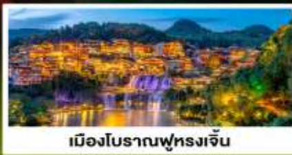
เมืองโบราณฟู่ทงเจิ้น