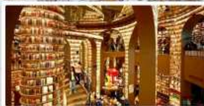
ร้านหนังสือจงซูเก๋อ

เดินทางโดย: สายการบินเฉิงตูแอร์ไลน์ (EU)