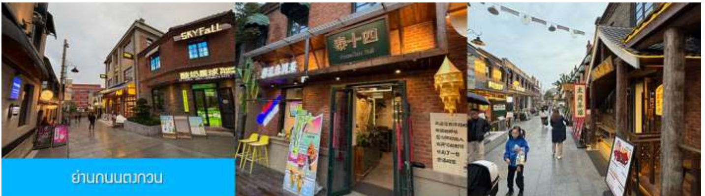
ย่านถนนตวงวอน

หลังอาหารนำท่านเที่ยวชม จัตุรัสชิงไห่ 星海广场 เป็นจัตุรัสขนาดใหญ่เป็นแลนด์มาร์คสำคัญของเมืองต้าเหลียน สร้างขึ้นเพื่อเฉลิมฉลองในโอกาสที่รัฐบาลอังกฤษคืนเกาะฮ่องกงในให้จีนในปี ค.ศ. 1997 ตั้งอยู่ชายฝั่งทะเลในเมืองต้าเหลียน เป็นจัตุรัสใจกลางเมืองที่ใหญ่ที่สุดในโลกและเป็นแลนด์มาร์คของเมืองต้าเหลียน รายล้อมด้วยตึกระฟ้าที่ทันสมัย ภายในมีบ่อน้ำพุดนตรี ลานหญ้าขนาดใหญ่ และลานกว้างสำหรับจัดกิจกรรมกลางแจ้ง อาทิ เทศกาลเบียร์นานาชาติ การแข่งขันวิ่งมาราธอน งานแฟชั่นนานาชาติเมืองต้าเหลียน ฯลฯ