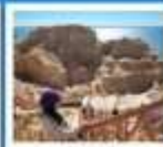
เขตพิศาจทะเล