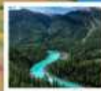
อุทยานคานาสือ