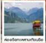
เบ่ไห่ชานฉีชาน