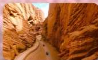
แกรนด์แคนยอนอาดูซื่อ