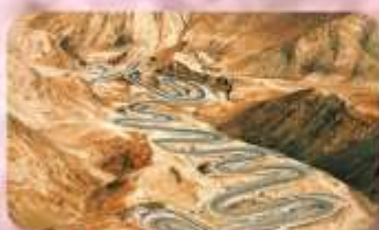
ถนนโบราณผืนหลงกุ้เต้า