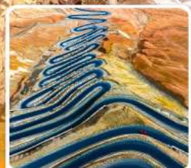
ถนนผานหลงตู้ต้าอว