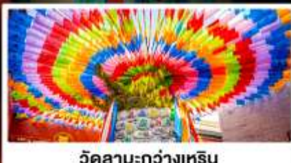
วัดลามะกว้างเหิน