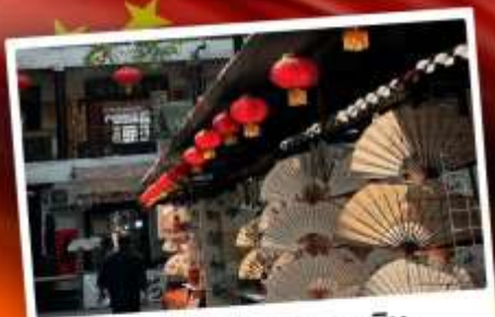
ถนนโบราณซูหยวนเหมิน