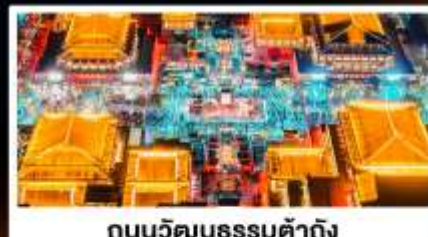
ถนนวัฒนธรรมต้าถิง