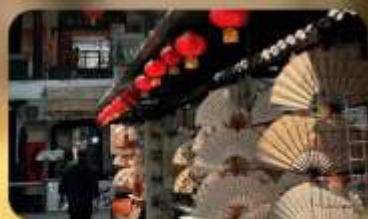
ถนนโบราณซูเหยี่ยนเหมิน