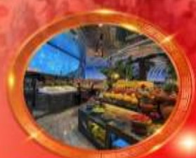
บุฟเฟต์หมีโพงซิ่ง