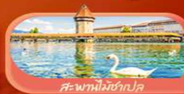
สะพานไม้ซังปก

Highlight เยือนหมู่บ้านแสนสวยเซอร์แมท เช็กอินศาลาไทยสุดงามที่โลซาน เที่ยวลูเซิร์น ชมสะพานไม้ซังและอนุสาวรีย์สิงโต ซาลี แพลทิน ชมประติมากรรม The Fork และปราสาทซิลลองริมทะเลสาบ เยือนมิลาน มหาวิหารดูโอโม เที้ยวเวนิส เมืองลอยน้ำสุดโรแมนติก อินกับรักอมตะที่บ้านจูเลียต และช้อปปิ้งจุใจที่ Serravalle Outlet