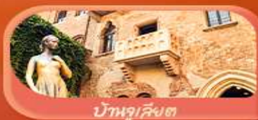
บ้านจูเลียต