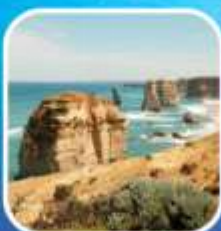
Great Ocean Road (ครึ่งสาย)