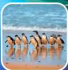
เพนกวินที่เกาะฟิลลิป