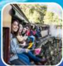
รถไฟจักรไอน้ำโบราณ